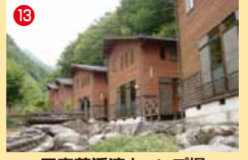
13 五家荘溪流キャンプ場