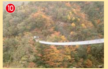
10 梅の木轟公園吊橋