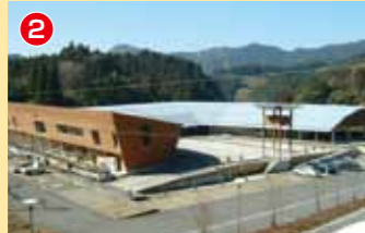
2 ふれあいセンターいずみ