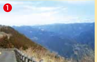
1 矢山岳山頂公園から