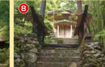
8 鬼山御前 保口神社