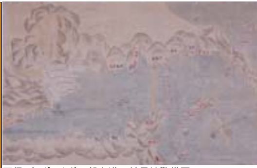
正保4年ポルトガル船入港二付長崎警備圖 長崎県立長崎図書館所蔵 大正時代模写 正保4年(1647)、国交回復を求めてポルトガル船が長崎に来航します。幕府は港を閉鎖し、ポルトガル船を追い返しました。