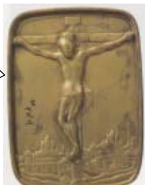
真鍮踏絵 キリスト像(十字架上のキリスト) 東京国立博物館所蔵 17世紀 国指定重要文化財

開幕当初、徳川幕府はキリスト教を容認していましたが、慶長十七年(一六一二)禁教の方針を打ち出すと、宣教師や信徒に対してさまざま弾圧を加えるようになりました。