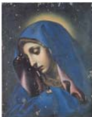
聖母像(親指のマリア) 東京国立博物館所蔵 17世紀後期 国指定重要文化財