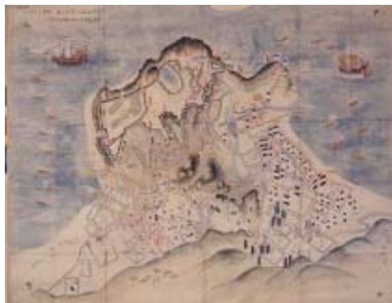
島原城攻撃圖 東京国立博物館所蔵 寛永18年(1641)カ

原城総攻撃 寛永15年2月27~28日 一ヶ月以上もの間原城を包囲し続けた幕府軍は、寛永十五年二月二十八日を総攻撃の日と定めます。ところが、二の丸方面を担当した鍋島軍が抜け駆けしたため、予定より一日早い二十七日に戦闘が始まりました。城乗りは、三の丸・二の丸・天草丸の三方面に分けられ、細川・立花軍が三の丸、鍋島軍が二の丸、黒田軍が天草丸へと乗り込みました。戦闘は翌日まで続き、多くの犠牲者を出して、落城しました。一揆勢はその多くが命を失ったといわれており、原城跡からは、現在もなお多くの遺骨が出土しています。