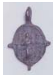
原城跡出土品(南有馬町教育委員会所蔵) 左:十字架 右:メダイ 原城跡からは、当時の遺品が見つかります。メダイは、遺骨の歯の近くにあり、口にくわえて死んでいったのではないかと考えられます。