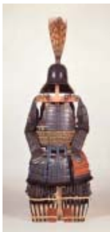
銀札啄木系射向紅威具足 永書文庫所蔵 江戸時代前期 細川忠利が島原で着用したと伝えられています。