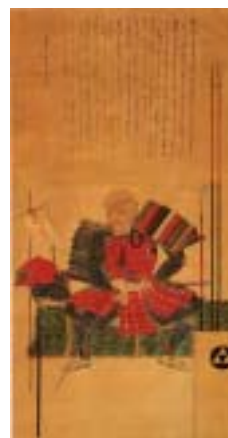
沢村大学画像 成道寺所蔵 正保2年(1645) 細川家臣沢村大学の島原出陣の姿を描いたものです。