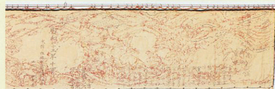
水引幕の裏 赤い糸で、外れてきた表の金糸を幕に縫いとめています。

金糸で亀が刺繍された豪華な水引幕。これは、約100年前の明治32年(1899)に作られたものです。裏には様々な赤い糸で補修した跡が見え、たくさんの人たちが笠鉾をまちの宝として大切に受け継いできたことがわかります。