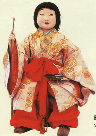
「菊慈童」・人形 経文の書かれた菊の葉の露を飲んで不老不死の仙人になった少年。

笠鉾には、謡曲に題材を求めたものや、美しい花や動物などの飾りが多く見られ、どれも不老長寿や商売繁盛への願いがこめられています。