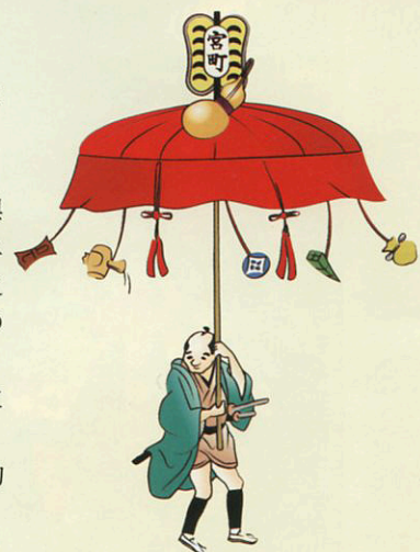
笠鉦菊慈童初期の姿 (推定図)

豪華な飾りのついた笠鉦は、いわば“ ふりゅう 風流化されたまちの印”なのです。様々な工芸技術が集約 された笠鉦はまさに妙見祭の華といえます。