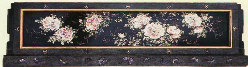
「本蝶蕪」・青貝細工の伊達板 文化7年(1810)制作

青貝細工は、薄く研ぎだした貝の裏から彩色し、型を抜いて漆器に貼り付けていく技法で、長崎青貝細工や長崎漆器ともいわれるように長崎で作られていました。この伊達板は、制作年のわかる青貝細工の作品の中で最古のものとして注目されています。