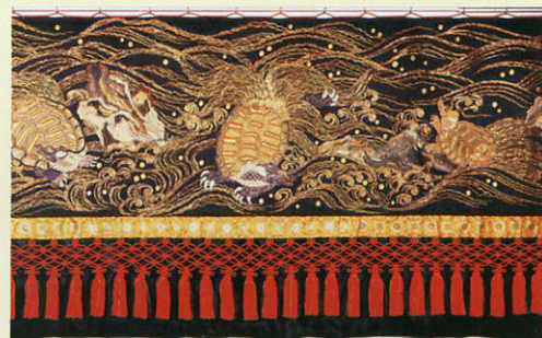
「蘇鉄」・黒紋縹子地蔵に波瑞亀模様刺繍水引幕