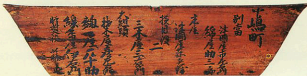
「蜜柑」の蛇腹の裏に記された宝暦3年(1753)の改修のときの記録です。どのような人たちが関ったかを知ることができます。