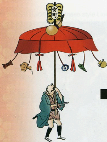
early stage of Kasaboko visual representation 初期的笠鉾 想象图 초기의 가사보코(笠鉾)상징 그림

가사보코는, 구엣수도의 도시에서 내놓는 9기의 축제때의 장식한 수레입니다. 17세기 후반부터 선보이게 되었습니다. 가사보코(笠鉾)의 초기 모습은, 혼자쓰는 큰 양산이었습니다. 그후 이중의 양산의상연물을 4사람이 쓰는 것 같은 모양이 되고, 현재의 가사보코(笠鉾)가 되었습니다. 가사보코(笠鉾)의 외관은, 2층 건물의 건조물과 같이 보입니다. 그러나, 각부품을 떠받치고 있는 것은, 중앙의 기둥 1개입니다. 양산을 그대로 크게해서 호화스럽게 한 것이 가사보코(笠鉾)입니다. 이러한 형태의 상연물은 다른 지역에는 없습니다. 야쓰시로(八代) 오리지널인 상연물입니다.