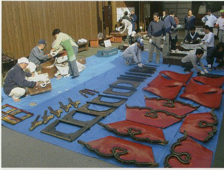
Kasaboko is made from 200 to 300 parts. The skill of assembling it is also valuable cultural knowledge.

由200至300个零部件组装而成的笠钵。 每个街坊代代相传的组装技艺也是一种重要的文化遗产。