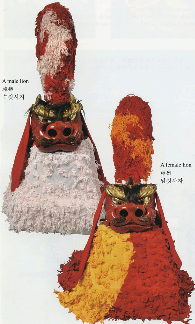
A female lion 雌獅 암컷사자

Two people are in a Shishi, in charge of the head and tail. A male lion has a red and white body, and two horns. A female lion has a red and yellow body, and one horn.