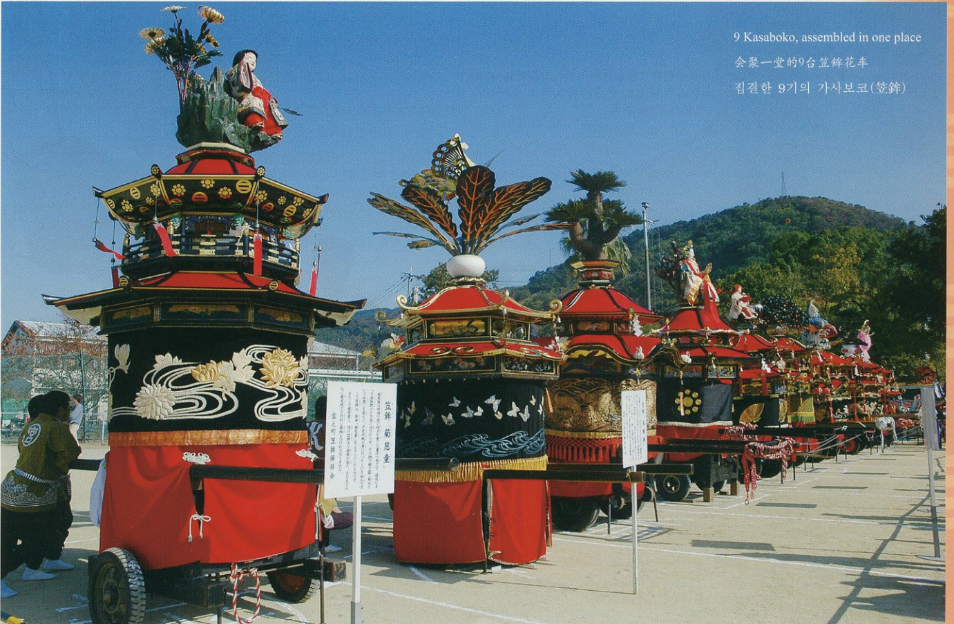
9 Kasaboko, assembled in one place