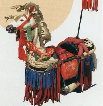
Kinma, made in 1873. 1873年制作的木马 1873년에 만들어진긴마(木馬)