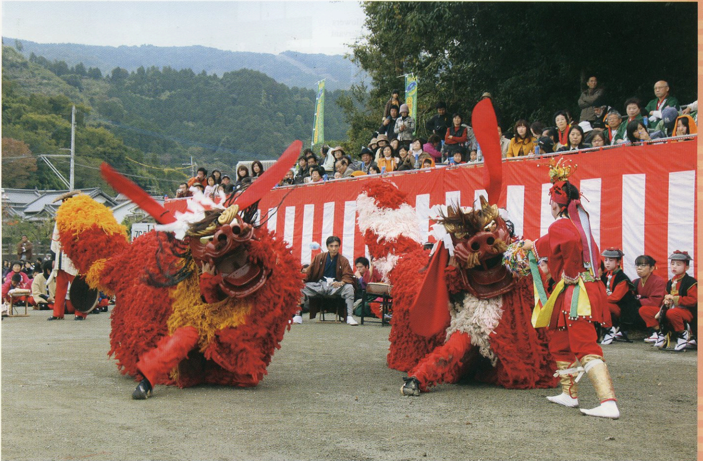
A male lion 雄獅 수컷사자