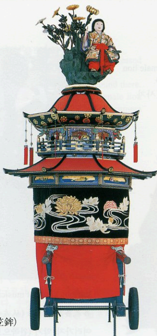
present Kasaboko 현재의 가사보코(笠鉾)