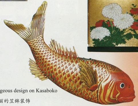
gorgeous design on Kasaboko