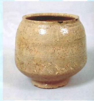
16 徳川家康から贈られた水指 (茶の湯に使う道具) (一般財団法人松井文庫所蔵)