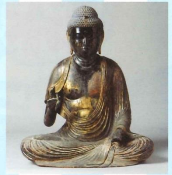
12 阿彌陀如来というほとけさまの像(本町・盛光寺蔵)