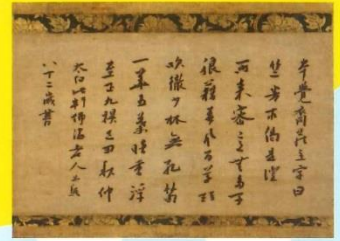
11 平石如砥というえらいお坊さんが書いた偈(教えの書) (一般財団法人松井文庫所蔵) 前期展示: 7月14日(金)~8月6日(日)