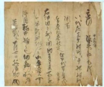
13 「八千把村」と書かれた741年前の古文書(個人蔵)