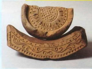
14 興善寺という古いお寺の跡から出土した瓦 (興善寺町・明言院蔵)

この展覧会では、普段なかなか見ることができない指定文化財を一堂に展示します。いったいどんな「宝もの」なのかわせひ見にきてください。