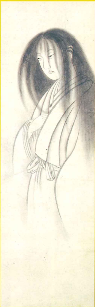
幽霊図 駒井源晴 18世紀 福岡市博物館所蔵