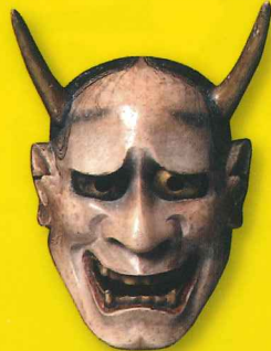
能面 般若 児玉近江満昌作 17~18世紀 松井文庫所蔵