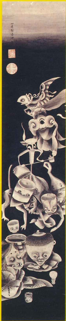
付喪神図 伊藤若沖 18世紀 福岡市博物館所蔵